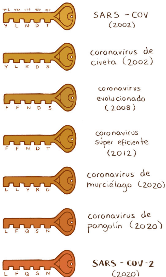
Figura 2. Podemos pensar en la proteína S como una llave que reconoce a una cerradura. La cerradura es la enzima ACE2. Las distintas proteínas S de distintos coronavirus tienen distintos aminoácidos en los "dientes de la llave". Algunos de estos aminoácidos son mejores que otros para abrir la cerradura.

reconocimiento de la enzima ACE2. Las posiciones son la 447, 472, 479, 480 y 487. Estas 5 posiciones pueden estar ocupadas por distintos aminoácidos en distintos coronavirus que infectan a diferentes especies. Además, en cada posición, algunos aminoácidos son mejores que otros para infectar a la misma especie (Figura 2).